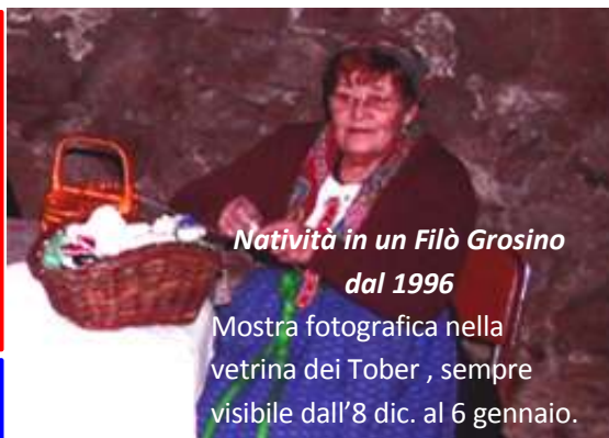
Natività in un Filò Grosio dal 1996

16 dicembre ore 17 INIZIO NOVENA DI NATALE