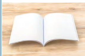
FOTO PER IL PROSSIMO BOLLETTINO

Nel Bollettino che uscirà in primavera vorremmo, come negli anni scorsi, pubblicare le foto dei battezzati, dei novelli sposi e dei morti dell'anno 2018. Vi chiediamo gentilmente di farci pervenire le foto entro la fine di gennaio, o portandole al Bar dell'Oratorio o inviandole via e-mail a info@parrocchiadigrosio.it oppure oratoriopiergiorgio@libero.it , specificando il nome del battezzato, degli sposi o del defunto.